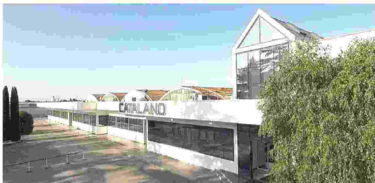
Ceramica Catalano. Il gruppo passa sotto il controllo di Mittel

La componente export del gruppo salirà dal 45% a oltre il 50%, con sinergie commerciali e produttive