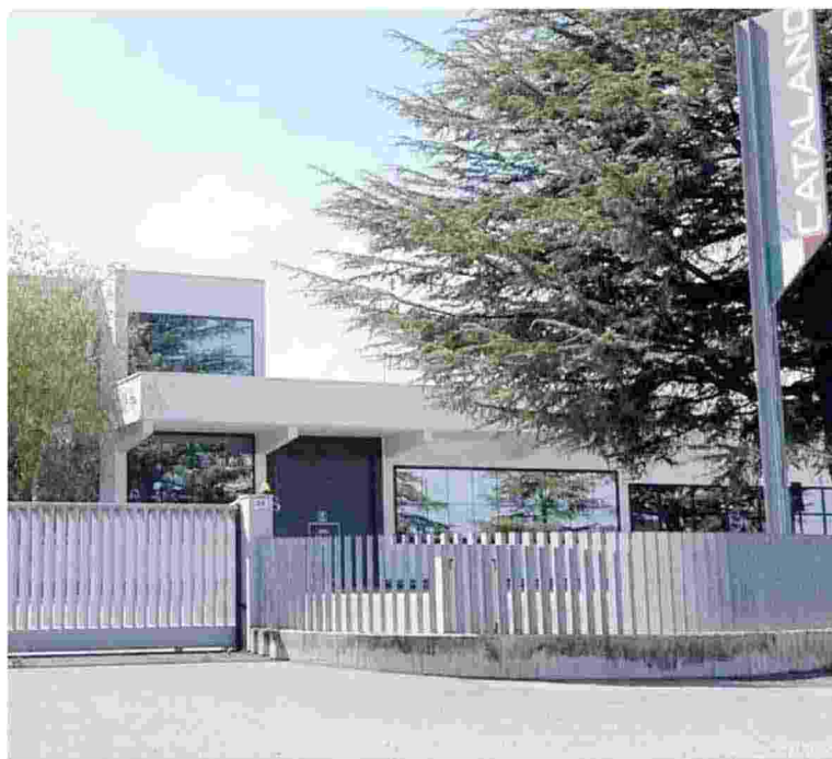
Lo stabilimento delle ceramiche Catalano a Civita Castellana

L'AZIENDA, CHE OCCUPA 250 LAVORATORI, È IL FIORE ALL'OCCHIELLO DEL DISTRETTO